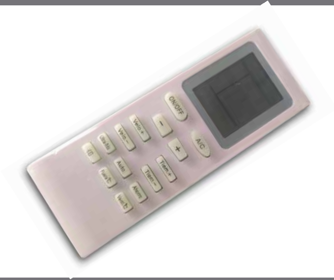
EL 9561 CONTROL REMOTO RT35 / SB30 / SB25 / SB20