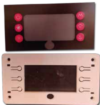
AAC 1077 MARCO DE PLÁSTICO Y CONTACT DISPLAY RT 35 SLIM