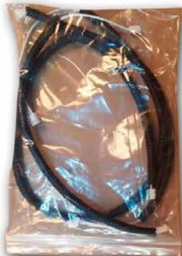
EL 9564 JUEGO DE CABLES P/ LUCES LED RT 35 SLIM