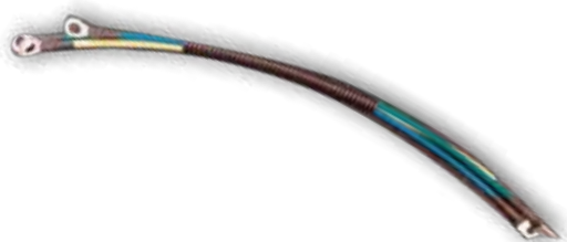
EL 9565 CABLE CONEXIÓN COMPRESOR RT 35 SLIM