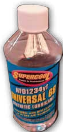
AAC 8770 ACEITE COMPRESOR ELÉCTRICO POE 68