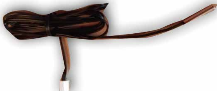
AAC1068 SONDA BOCA DE SALIDA