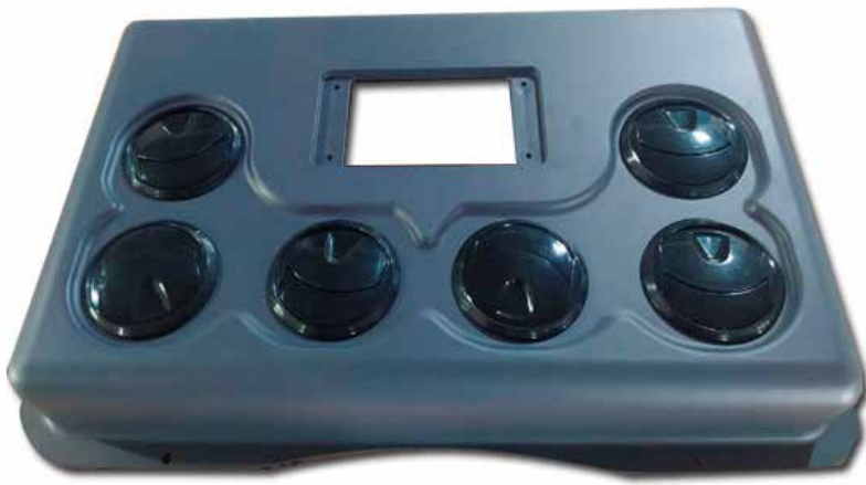
AAC 1073 CARCASA PLÁSTICA EVAPORADOR RT 35 SLIM