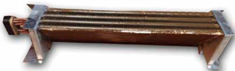
EV 815 EVAPORADOR RT 35 SLIM