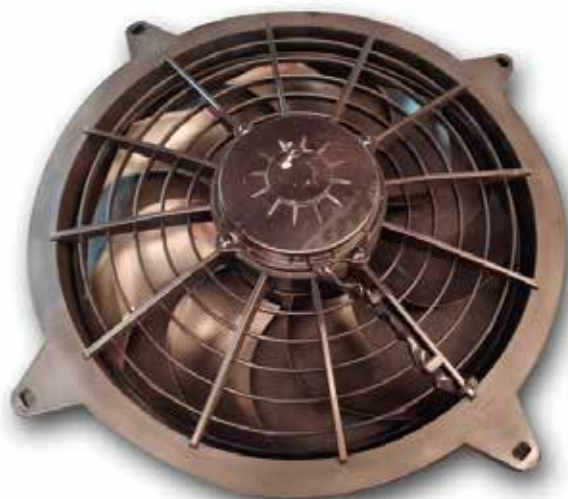
EL 4440 ELECTROVENTILADOR RT 35 SLIM / SB25 12 V