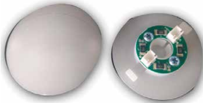
EL 9562 LUCES LED CUBRE TAPIZADO RT 35 SLIM RT 35 AGROMAX