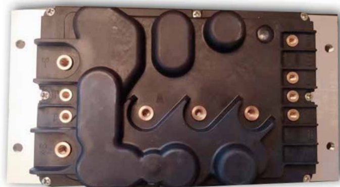
EL 9593 ( 24V ) EL 9592 ( 12V ) CAJA ELECTRÓNICA RT 35 SLIM 4 PINES