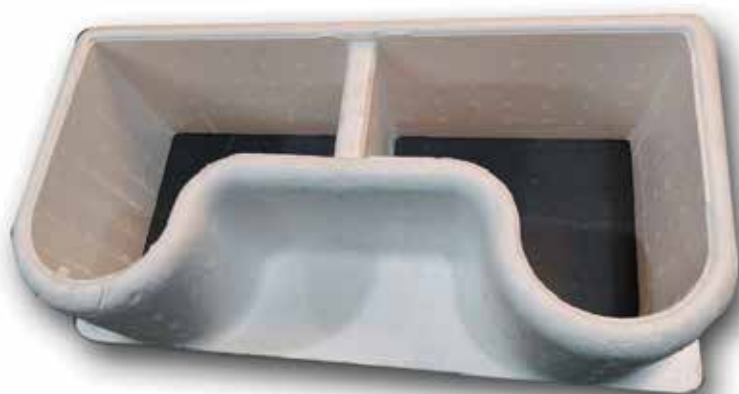
AAC 1075 ENCAUSADOR DE AIRE RT 35 SLIM