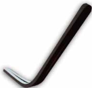
AAC 1065 ARO NEOPRENE RT 35 SLIM / RT 35 MODELO ANTERIOR