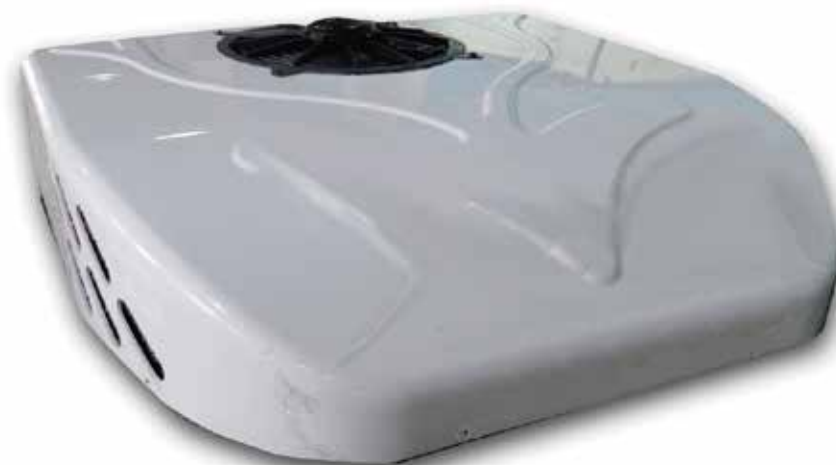
AAC 1083 CARCASA PLÁSTICA RT 35 Agromax