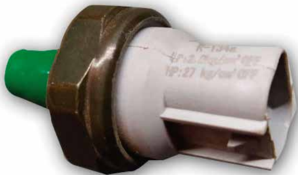
PR 444 PRESOSTATO RT 35 SLIM