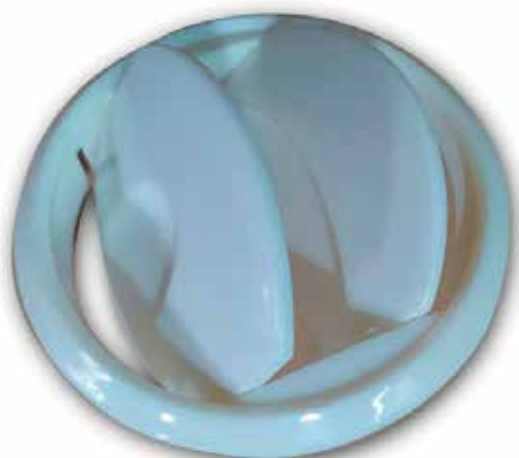
AAC 1071 BOQUILLA DIFUSOR BLANCA SB30/SB25/SB20