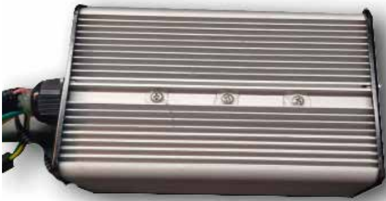
EL 9467 AR CAJA ELECTRÓNICA (24V) SB25 / SB20