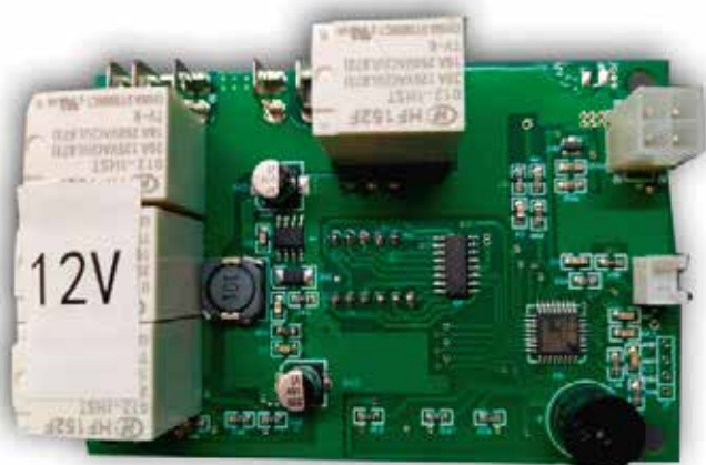
EL 9558 PLAQUETA DISPLAY (12V) RT 35 (MOD.ANTERIOR) /SB25 / SB20