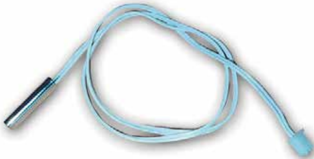
AAC 1068 AAC 1068.AR SONDA DE TEMPERATURA RT35/ SB30/SB25/SB20