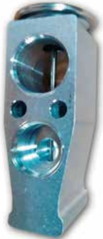
VAL 7176 VÁLVULA BLOCK RT35/ SB30/SB25/ SB20