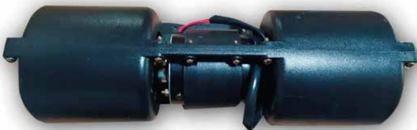
EL 9552 (12 V) EL 9553 (24 V) EL 9555 (12 V) EL 9556 (24 V) VOLUTA RT 35/SB30 / SB25 / SB20 (12V) / RT 35 SLIM